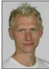
Af Kasper Lund Kirkegaard, Idrættens Analyseinstitut

"Som kynisk forretningsmand har jeg i princippet ingen interesse i, at kommunen laver en flot og inspirerende legeplads til glæde for byens børn."